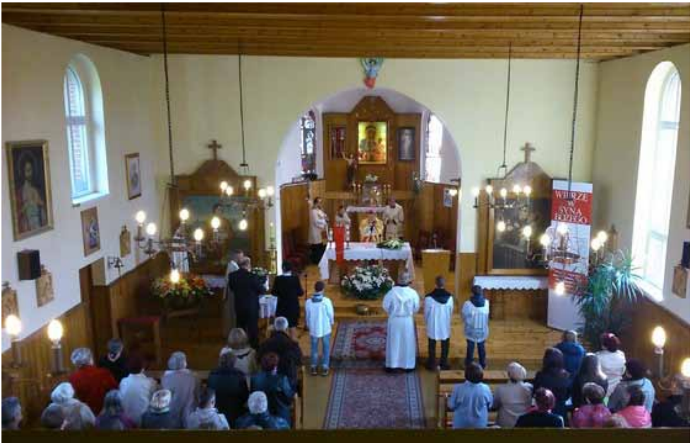
Ks. bp zagrody nasze widzieć przychodzi i jak się Jego dzieciom powodzi