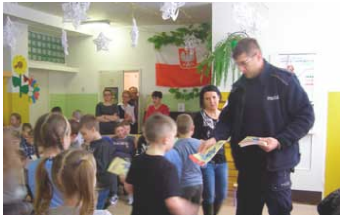
21.01.2016 R. BEZPIECZNE FERIE ZIMOWE

21.01.2016 r. przedstawiciele Powiatowej Komendy Policji w Kołobrzegu kolejny raz odwiedzili uczniów naszej szkoły. Przypomnieli o zasadach bezpiecznego wypoczynku w czasie ferii zimowych oraz postępowaniu w kontaktach z nieznanymi. Uczniowie klas pierwszych otrzymali materiały edukacyjne.