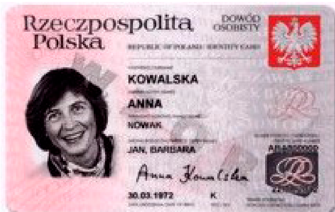
Data ważności dowodu osobistego

go wymeldowania się z dotychczasowego miejsca pobytu stałego lub czasowego przy dokonywaniu czynności zameldowania w nowym miejscu pobytu. Ponadto przypominamy o obowiązku wymiany dowodów osobistych, które utraciły ważność (serie AA... AB..., AC... oraz AD..., rok wydania dowodu osobistego 2001 do 2003)