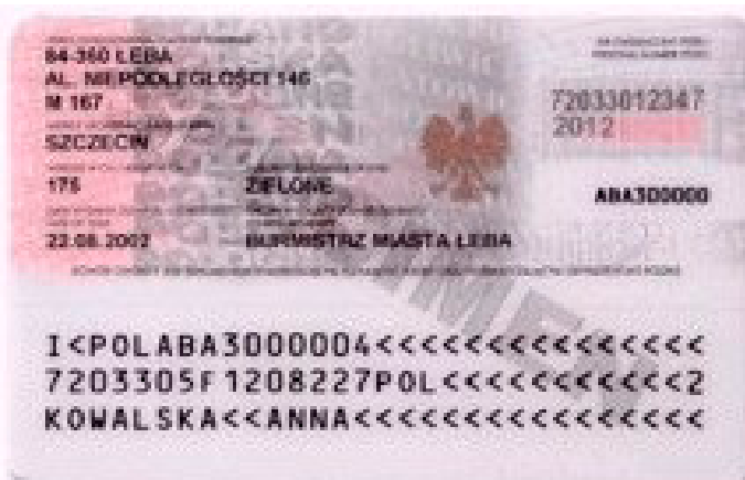
Seria dowodu osobistego (3 litery)