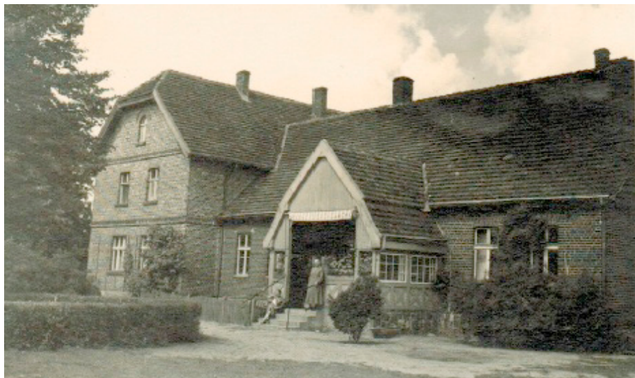
Dwór w Strebelow w 1933 r.

Jeszcze dzisiaj można spotkać się z potoczną wymową nazwy tej miejscowości jako „Szczęblewo”, co ma pewnie uwarunkowania w używaniu przez kilka lat powojennych nazwy Strzeblewo.