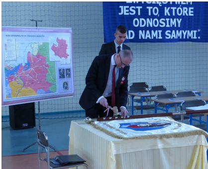
Przedstawiciel Pomorskiego Banku Spółdzielczego w Świdwinie - główny fundator sztantararu