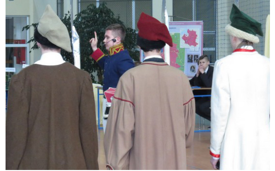
Inscenizacja historycznej przysięgi Tadeusza Kościuszki