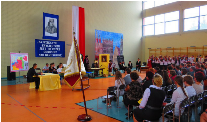
Część artystyczna w wykonaniu uczniów