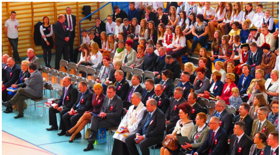
Zaproszeni goście i uczestnicy uroczystości