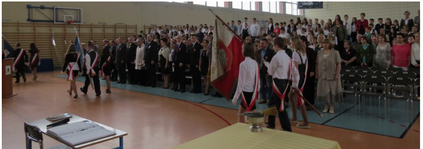
Powitanie pocztów sztantarowych z okolicznych szkół