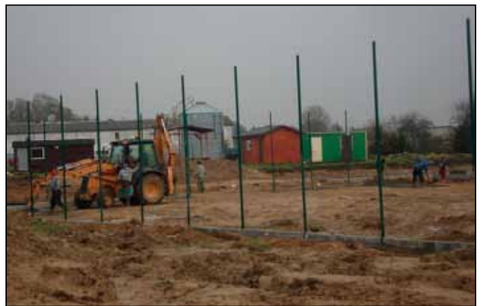
Budowa Olika 2012 w Gorawinie

4. Budowa zespołu boisk wielofunkcyjnych w ramach programu „Moje boisko – Orlik 2012” w miejscowości Gorawino.