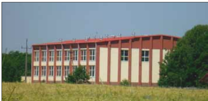
Hala widowiskowo – sportowa w Rymaniu