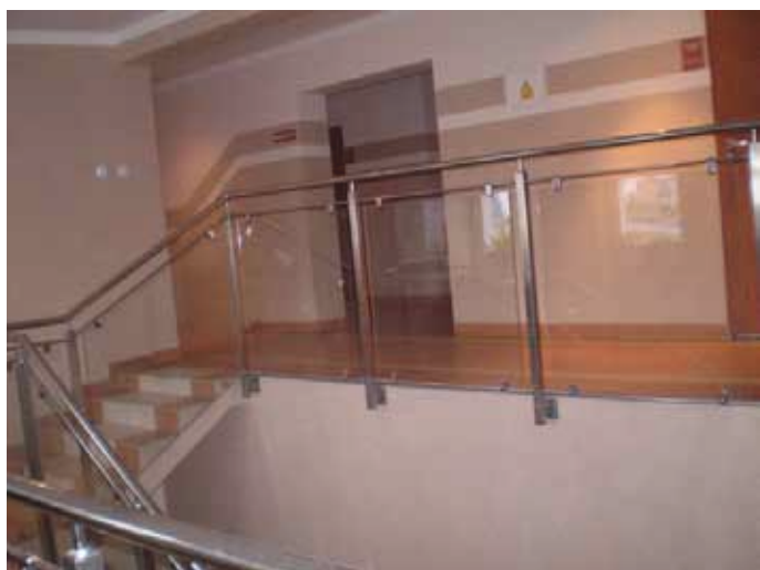
Remont wewnątrz Urzędu Gminy,

8. Remont wewnątrz budynku Urzędu Gminy.