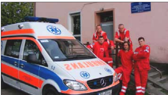
Pogotowie Ratunkowe w Rymaniu