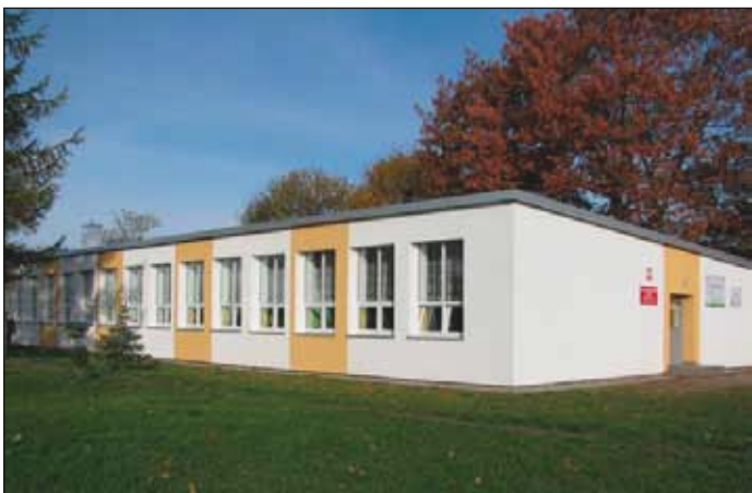
Budynek Szkoły Podstawowej w Dębicy