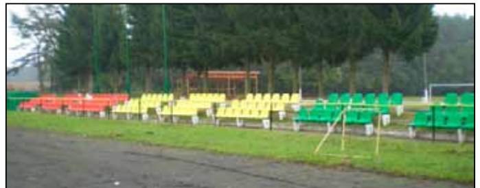
Siedziska na stadionie

5. Wymiana siedzisk na stadionie w Rymaniu - koszt zadania ok. 160 000 zł