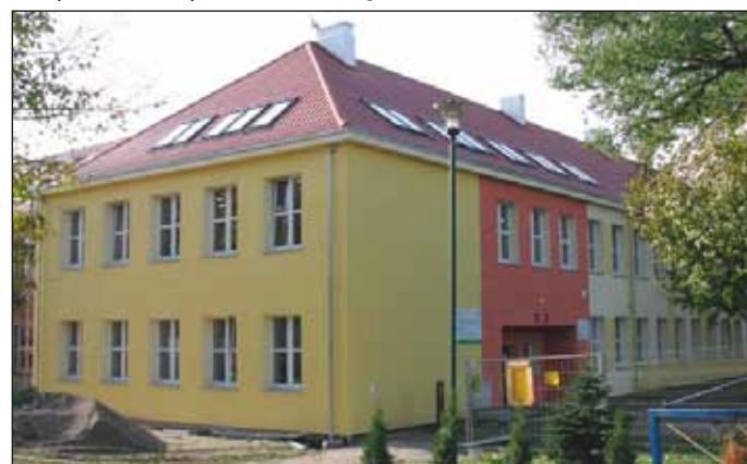
Budynek Szkoły Podstawowej w Rymaniu