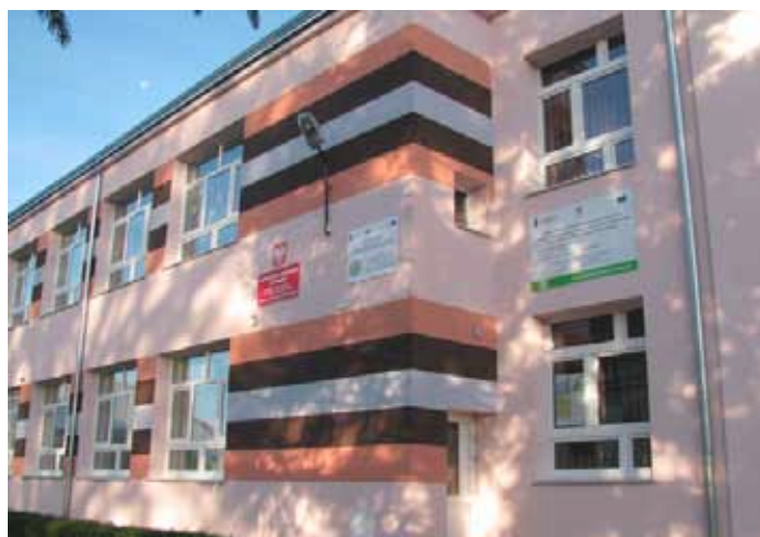
Budynek Szkoły Podstawowej w Drozdowie - nowy