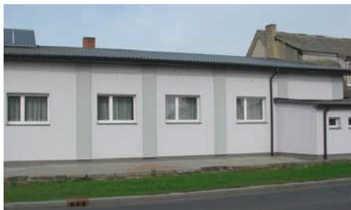
Budynek sali wiejskiej w Rymaniu.