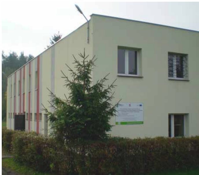
Budynek socjalny zaplecza stadionu w Rymaniu.