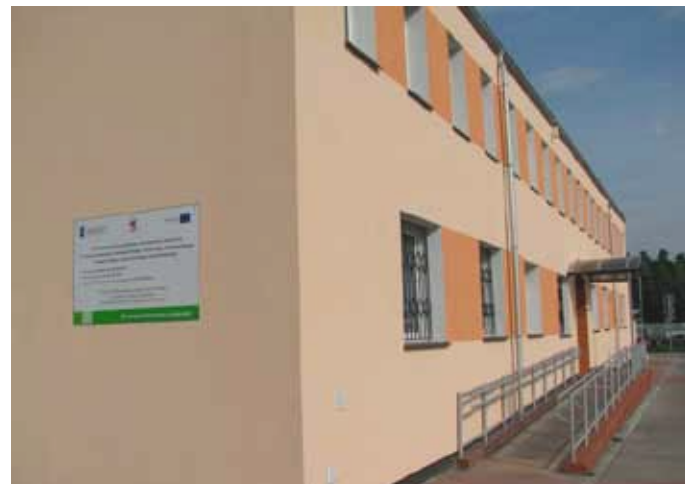
Budynek Urzędu Gminy w Rymaniu.