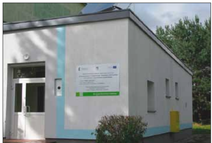
Budynek punktu lekarskiego w Gorawinie.