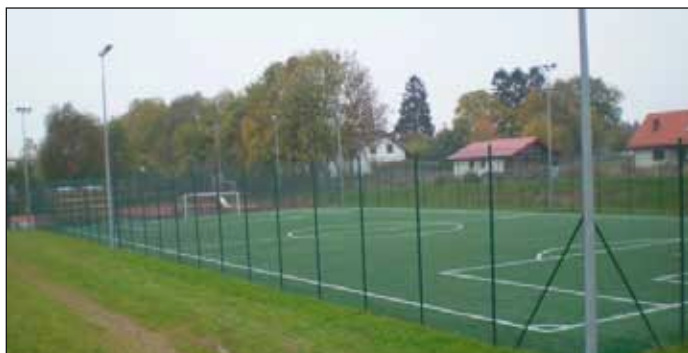
Orlik 2012 Rymań