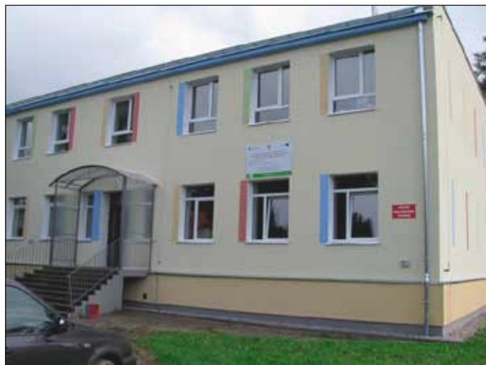
Budynek Szkoły Podstawowej w Gorawinie