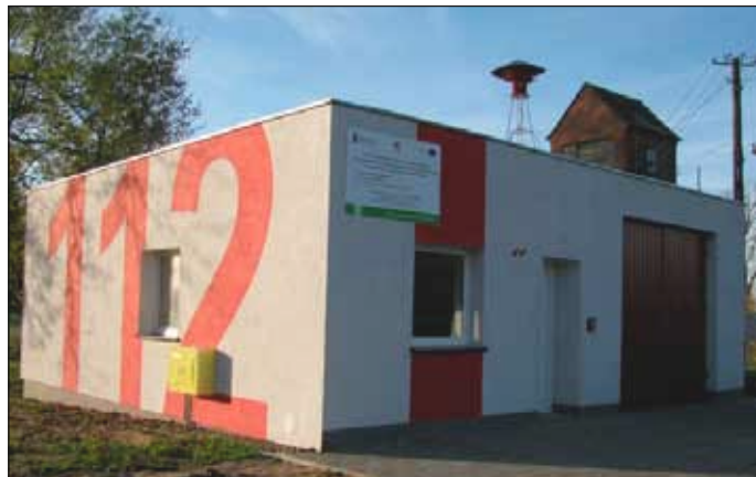
Budynek Remizy OSP w Drozdowie