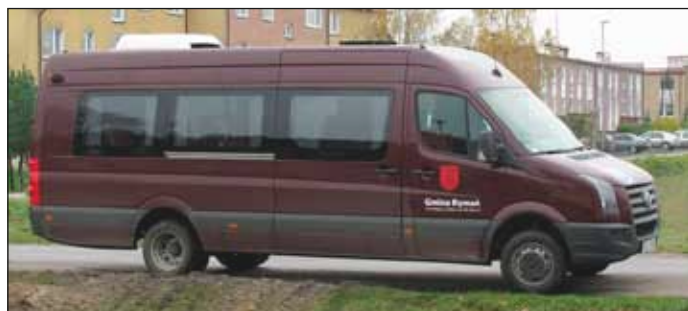
Samochód do przewozu osób niepełnosprawnych