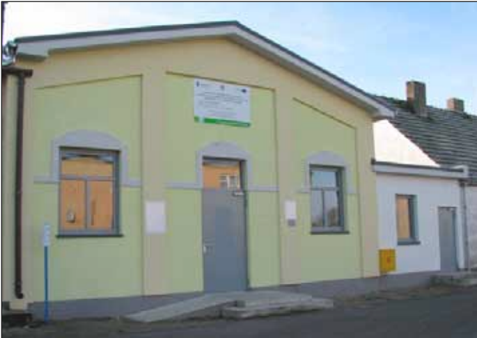
Budynek sali wiejskiej w Drozdowie.

2. Rozpoczęto budowę sali wiejskiej w Jarkowie.