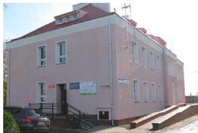
Budynek Ośrodka Zdrowia w Rymaniu