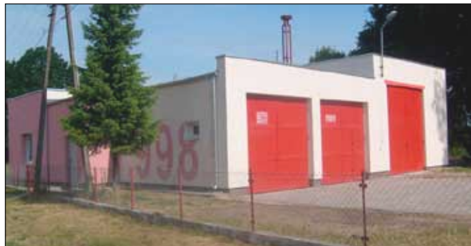
Remiza OSP w Rymaniu