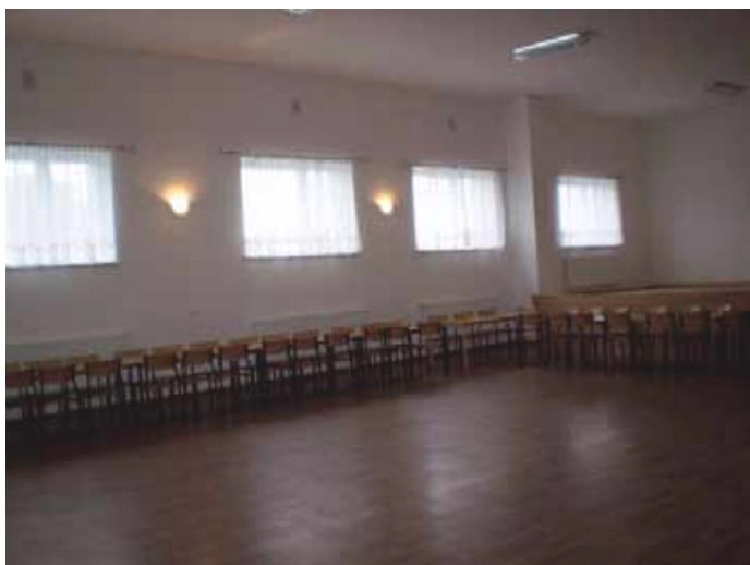
Remont wewnątrz sali wiejskiej w Rymaniu

6. Remont wewnątrz budynku w sali wiejskiej w Rymaniu, to jest: wykonanie nowych tynków, instalacji elektrycznej i c.o., wykonanie nowej podłogi, remont sanitariatów i zaplecza sali.