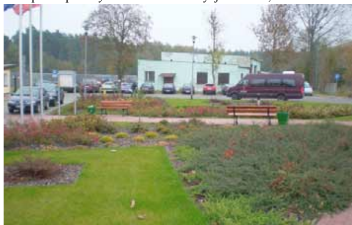
Zagospodarowanie terenu przed Urzędem Gminy

12. Przebudowa parkingów wraz z zagospodarowaniem terenu przy Urzędzie Gminy. Zadanie obejmowało odnowienie terenu, budowę kanalizacji deszczowej, parkingów i podjazdu dla osób niepełnosprawnych. Wartość inwestycji 774 217,54 zł.