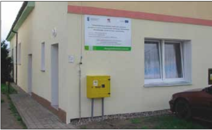
Budynek sali wiejskiej w Gorawinie