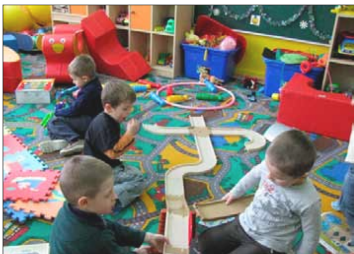
Punkty przedszkolne - Starnin