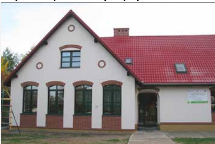
Budynek Szkoły Podstawowej w Starninie