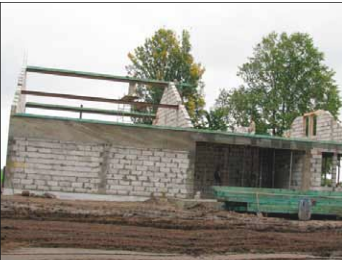
Budowa sali wiejskiej w Jarkowie

Budynek sali wiejskiej o pow. 309,97 m 2 będzie mieścił m.in. tj. hol, sala spotkań, zaplecze kuchenne, biuro, sala komputerowa itp. Świetlica z pewnością zaspokoi potrzeby społeczne i kulturalne mieszkańców, podniesie atrakcyjność miejscowości oraz stworzy miejsce spotkań dla społeczności lokalnej w tym głównie dzieci i młodzieży.