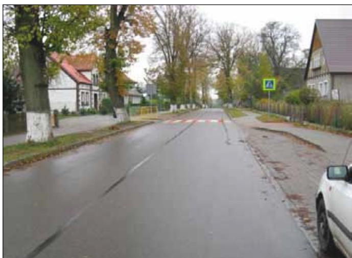
Droga w Gorawinie