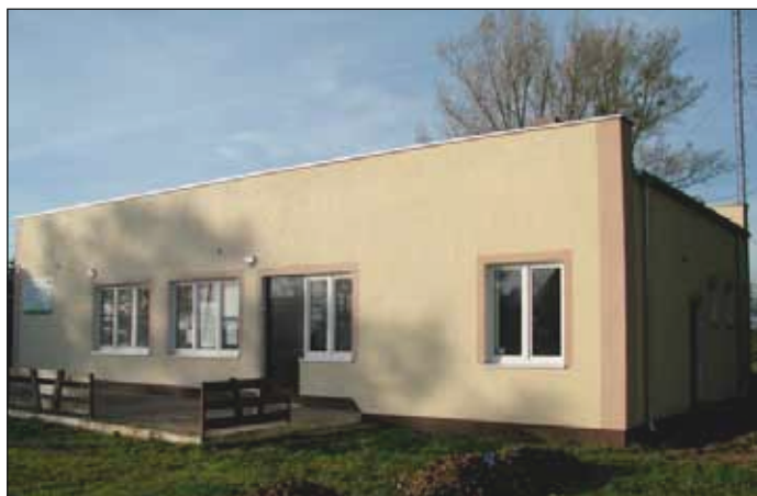
Budynek sali wiejskiej w Kinowie