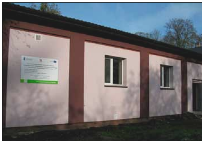
Budynek sali wiejskiej w Starninie.