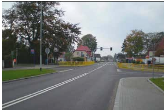
Przebudowa drogi krajowej nr 6