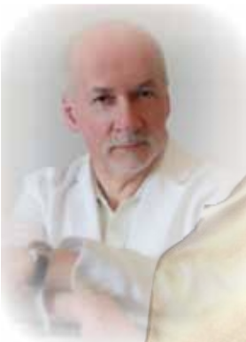
Piotr Kusiewicz - tenor