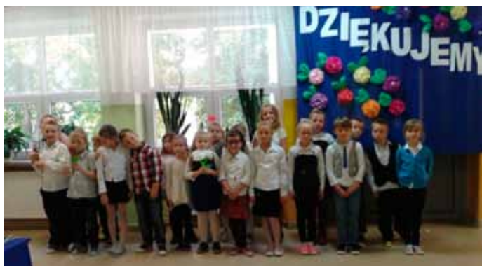
Dzień edukacji narodowej, październik 2015 r.