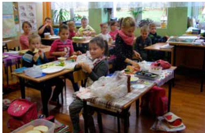
Śniadanie daje moc , listopad 2015 r.