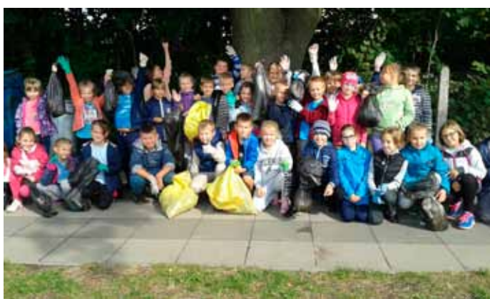
Wielkie sprzątanie świata , wrzesień 2015 r.