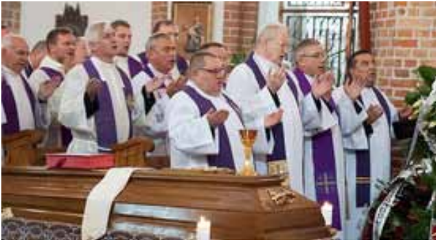
Mszę św. w intencji zmarłego kapłana koncelebrowało blisko 100 prezbiterów