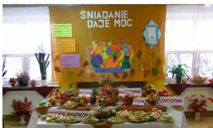
Śniadanie daje moc , listopad 2015 r.