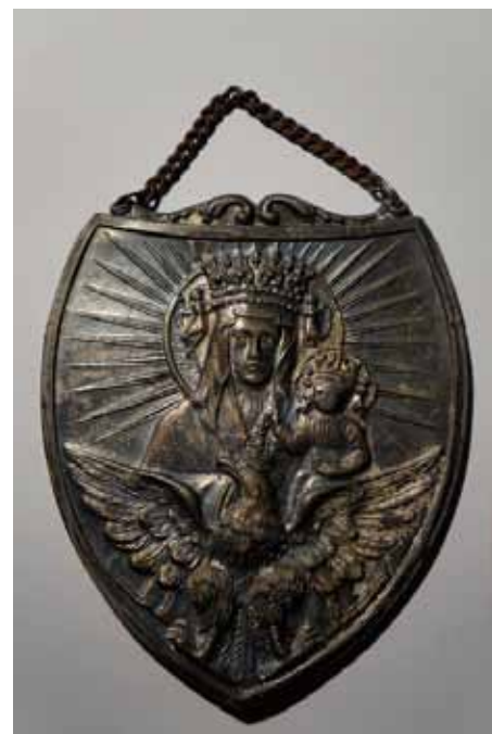
„Pamiątkowy ryngraf z Matką Boską”.

W Nowym Roku życzymy wszystkim sympatykom historii wielu ciekawych znalezisk, materiałów i informacji, które chętnie umieścimy w Regionalnej Izbie Muzealnej oraz opublikujemy na naszym portalu.