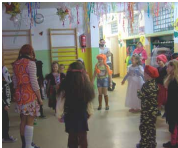
22.01.2016 R. ZABAWA KARNAWAŁOWA

21.01.2016 r. przedstawiciele Powiatowej Komendy Policji w Kołobrzegu kolejny raz odwiedzili uczniów naszej szkoły. Przypomnieli o zasadach bezpiecznego wypoczynku w czasie ferii zimowych oraz postępowaniu w kontaktach z nieznanymi. Uczniowie klas pierwszych otrzymali materiały edukacyjne.